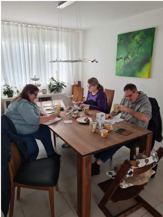
bim Heftli kreiere